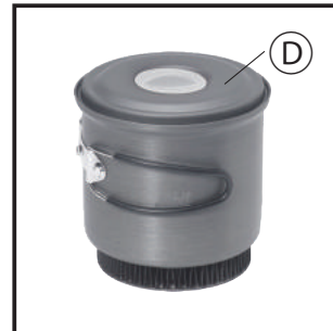
消化蓋・火力調整